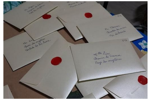
Les enveloppes du premier cours

Le FCA (Français Culture Antique) n'est pas obligatoire, c'est une option pour ceux qui ont des difficultés en Français. Cela se déroule 1h par semaine avec Mme Guillot avec une dizaine d'élèves de 6 e 5 et 6 e 6.