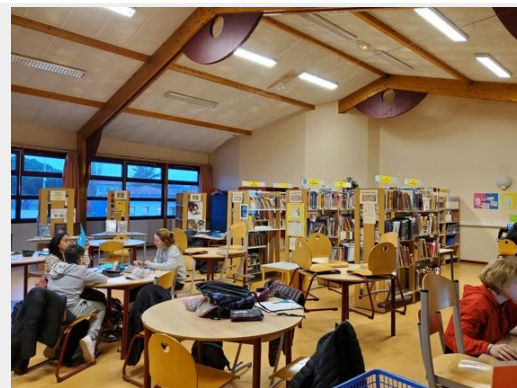
Le CDI

Elle est au CDI depuis septembre 2002. Il y a 16 000 livres au CDI et Mme Sotton rentre entre 150 et 200 nouveaux livres par an !